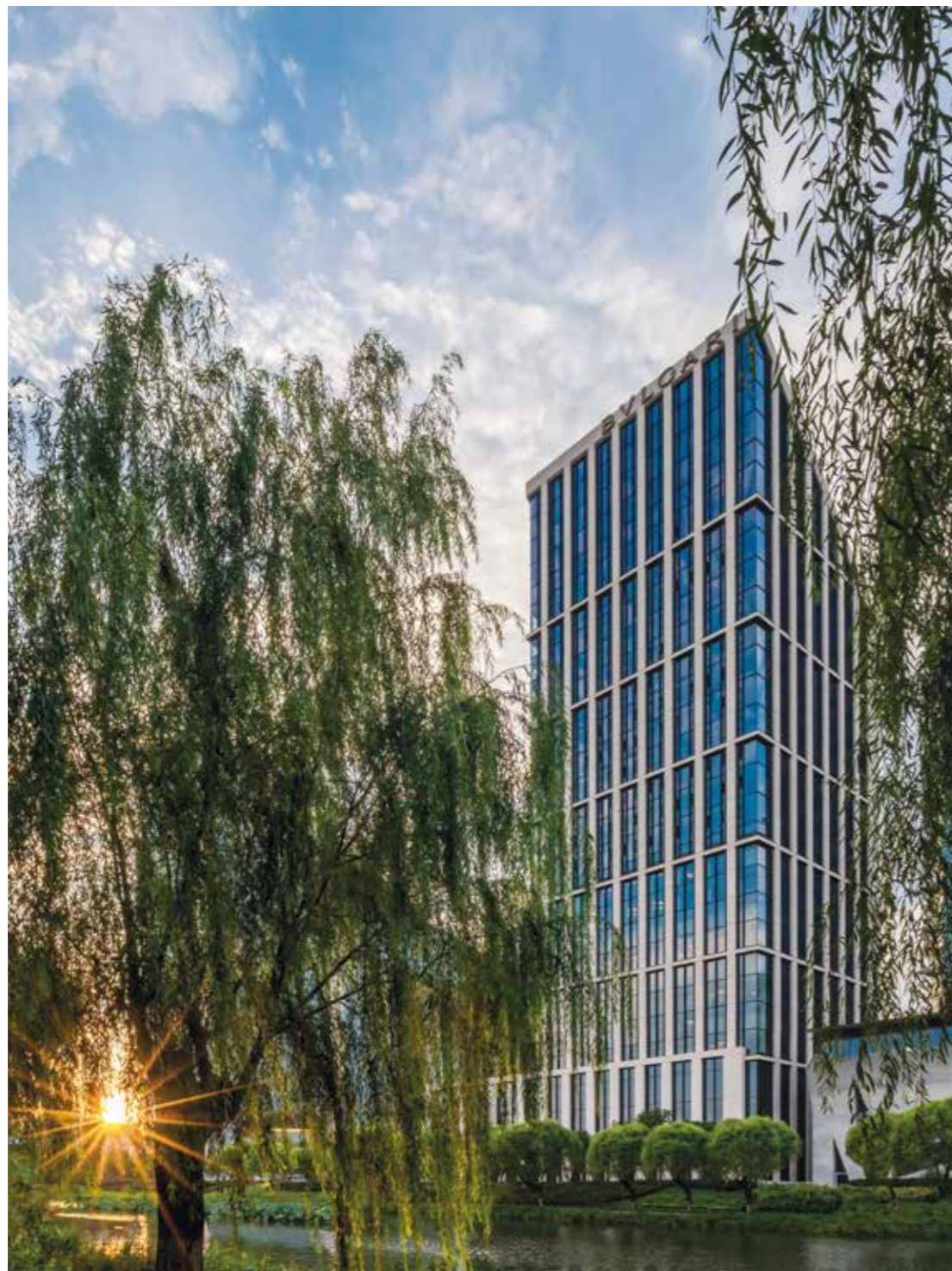
Die Gartenprojekte werden komplementär zum Architekten erarbeitet. The Bulgari Hotel Beijing. We try to work out the garden project in a complementary way with the architect.