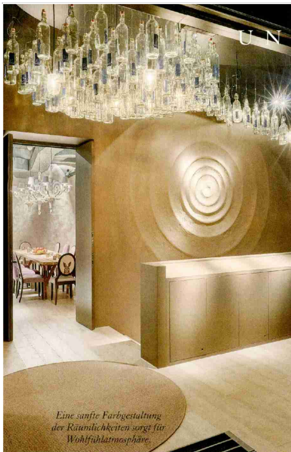
Eine sanfte Farbgestaltung der Räumlichkeiten sorgt für Wohlfühlumgebung.