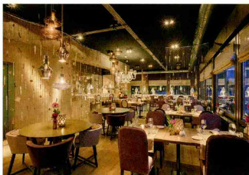
Die neue Innenraumgestaltung des Restaurants überrascht mit verspielten Details, wie den dekorativen Lampen und Raumtrennern.