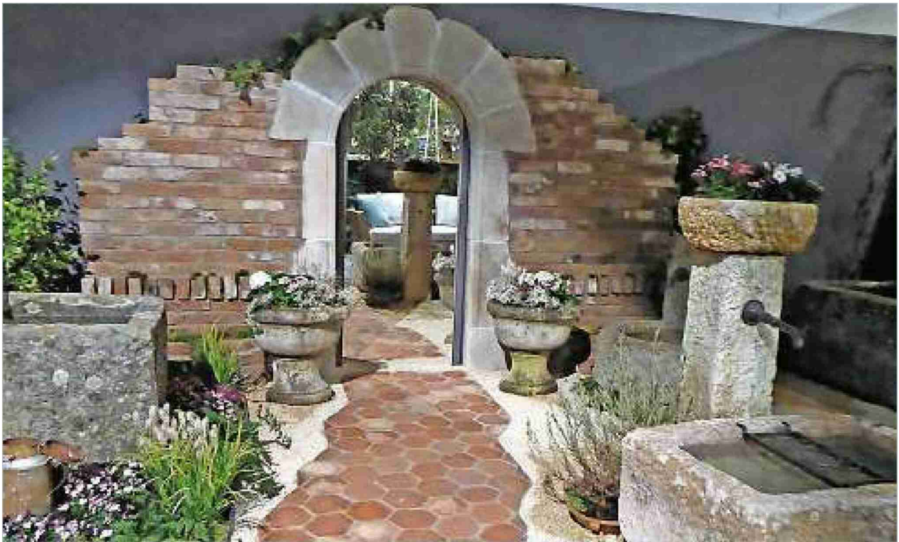
Das Brunnenparadies aus Suhr war auch dabei ... und wie

Die 20. Giardina war einmal mehr eine ganz tolle Angelegenheit. Allein schon die Schaugärten waren das Eintrittsgeld wert. Jährlich wird dafür ein Award abgegeben. Diesmal gewann die Aargauer Firma Stobag diesen wertvollen Spezialpreis.