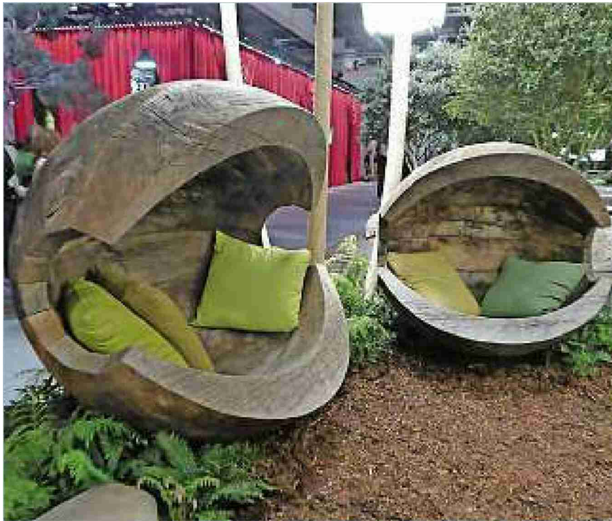
«Holz isch heimelig»

Referenz: 68978802 Ausschnitt Seite: 3/3