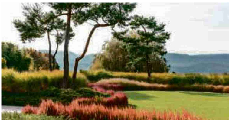
Beereits zum 20. Mal findet die Giardina statt. Renommierten Gartenarchitekten bringen Inspirationen für den eigenen Garten. Foto: Enea Landscape Architecture

Für eines der vielen Highlights sorgt 2018 der heute international renommierte Gartenarchitekt Enzo Enea: Zur 20. Ausgabe kehrt der Visionär dorthin zurück, wo er schon vor 20 Jahren Gartendesign zelebrierte wie niemand zuvor. Passend zu den diesjährigen Leitthemen präsentieren neben ihm und weiteren bekannten Giardina Ausstellerpersönlichkeiten der letzten 20 Jahre auch Newcomer ihre Ideen, wie Gartenträume als natürliche Weiterführung des Wohnraumes selbst auf kleinerem Raum wahr werden. REG.