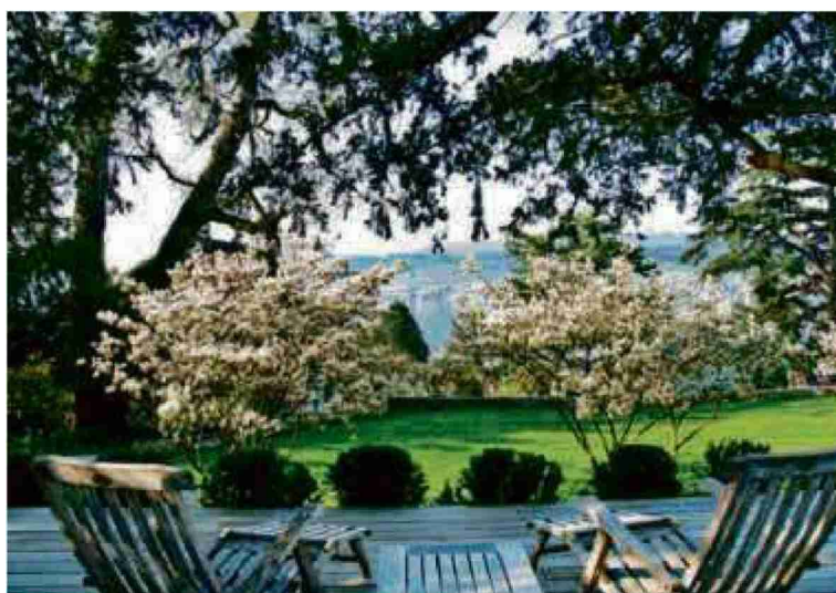
Ideen für Gartenträume auch auf wenig Raum gibt es an der diesjährigen Giardina zu sehen.