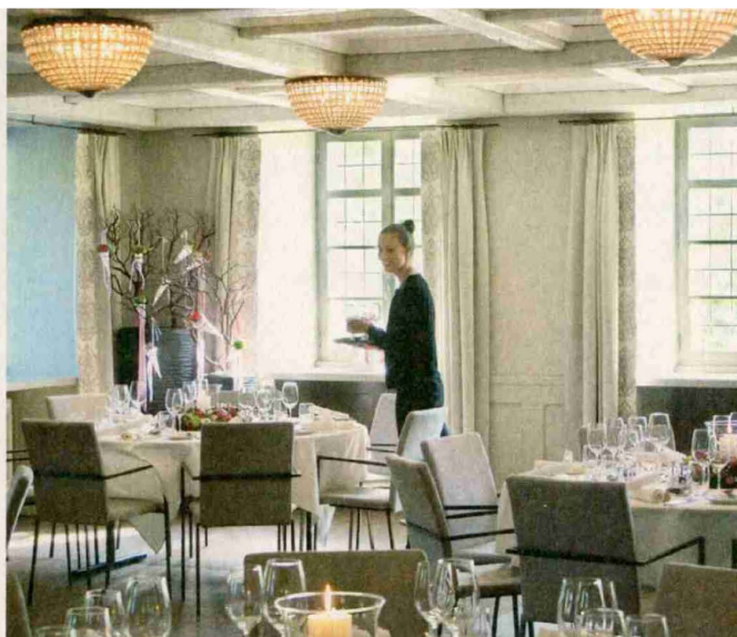
Bellebt für festliche Anlässe: der Burgensaal im Bad Bubendorf