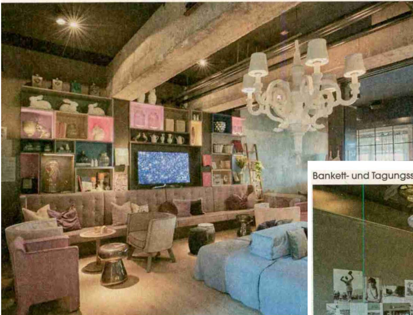
Bankett- und Tagungssaal Ramstal