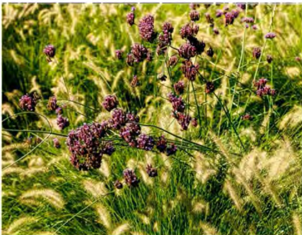
Rispenhortensien ( Hydrangea paniculata «Limelight») und Japansegge ( Carex morrowii ).