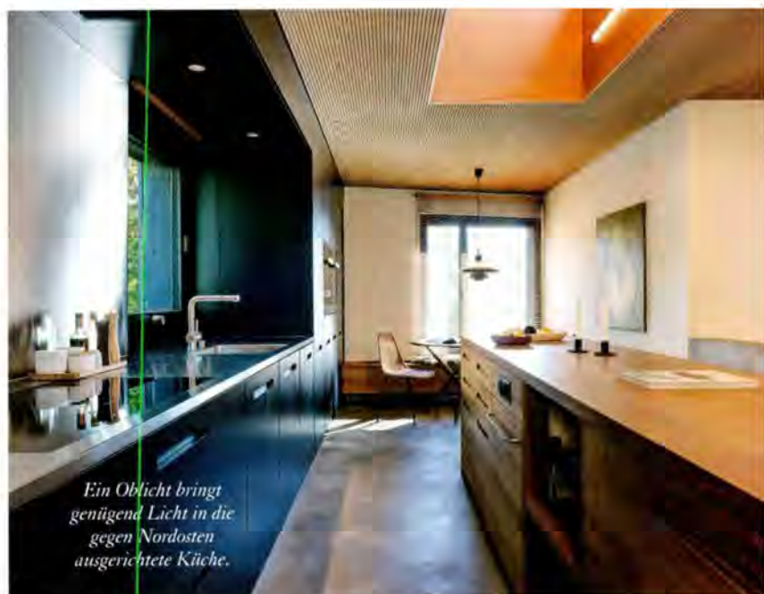
Ein Oblicht bringt genügend Licht in die gegen Nordosten ausgerichtete Küche.

Mit drei Oblichtern hat der Architekt dafür gesorgt, dass in den tiefen Grundriss genügend Tageslicht fällt, und dass Küche und Kinderzimmer, die gegen Nordosten gelegen sind, angemessen Tageslicht erhalten. Im Sommer kann quergelüftet werden, und die Raumhöhe variiert in diesen Räumen durch die Dachaufbauten. Die Massnahme sorgt also auch für Luft, im eigentlichen und im übertragenen Sinn.